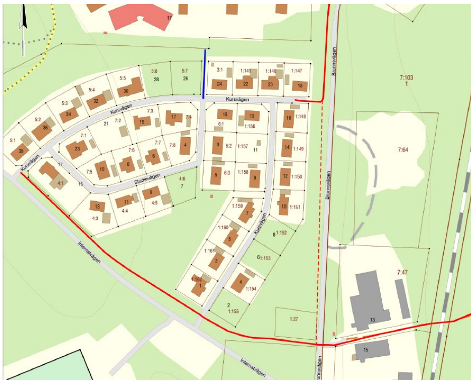
Figur 5: Utdrag ur kommunens CSM karta som visar befintliga cykelstråk i närheten till planområdet

I område finns idag två cykelstråk (huvudnät, på bilden ovan markerad med röd) samt ett litet lokalnät (markerad med blå) som kopplar bostadsområde med skolområde norrut. Kommunen planerar att koppla ihop de två huvudstråk.