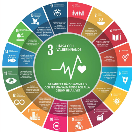
WHO:s illustration av FN:s globala mål - 3 Hälsa och välbefinnande.

Några av de mest grundläggande faktorerna för god hälsa är ekonomisk och social trygghet, framtidstro och känslan av sammanhang. Mål som bidrar till detta är exempelvis: