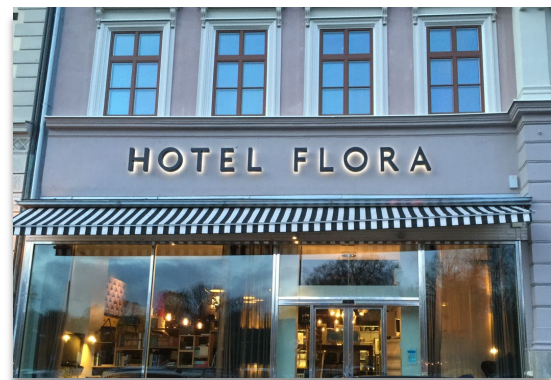
Belyst skylt med djupa kraftfulla bokstäver.