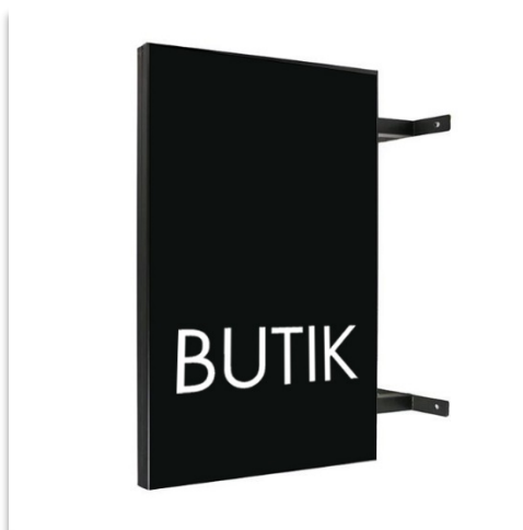
Flaggskyltning monteras i rät vinkel ut från fasad.