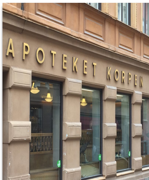
Frilagda bokstäver i metall.