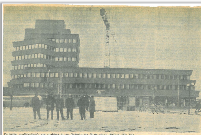
Vetlandas omdiskuterade nya stadshus är nu färdigt i sin första etapp. Stålligt, eller hur...

Bent Jørgen Jørgensen på toppen av sitt verk. Till höger syns första etappen färdig cirka 1968.