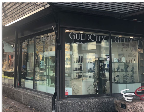
Fönsterdekor i dämpade färger.

Markiser på byggnaden undviks. Vid uppförande av markiser ska dessa utformas enfärgade i dämpad mörkgrå kulör. Reklam utöver verksamhetens eget namn är inte tillåtet. Samråd ska ske i en tidig fas med miljö- och byggförvaltningen för att undvika missförstånd.