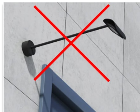
Belysning ska inte uppföras som vägglampor med armar.